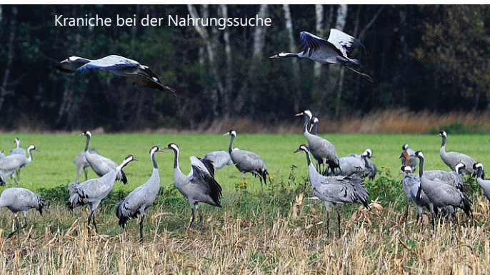
Kraniche bei der Nahrungssuche

Vom Aussichtsturm im Rehdener Geestmoor hat man sehr gute Beobachtungsmöglichkeiten.